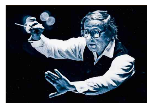
André Previn (1929–2019)

Er und seine Familie haben überlebt, die meisten anderen nicht. Als ob er diesem geschenkten Leben unbedingt gerecht werden wollte, hat er, hochbegabt, mit dem absoluten Gehör versehen, seine Zeit auf Erden der Musik gewidmet: fleißig, ausdauernd, originell, ehrlich, kollegial wie wenige. Vier Oscars, zehn Grammys und der englische