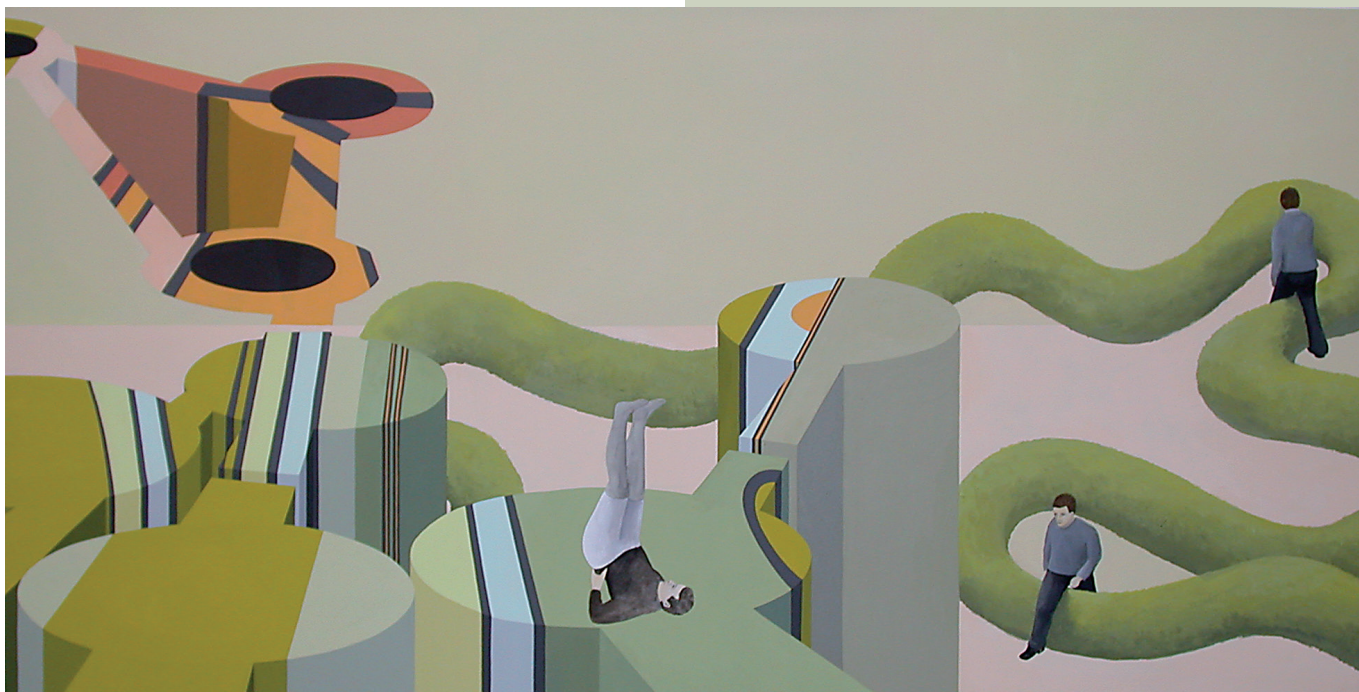
Vielleicht war dieses Ordnen die eigentliche und heftigste Leidenschaft

Die Künstlerin ist anwesend. Zur Ausstellung erscheint ein Katalog.