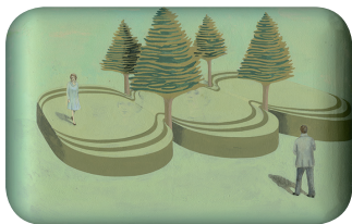
Eine das Angebot weit übersteigende Nachfrage