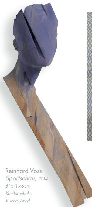
Reinhard Voss Sportschau , 2014 51 x 11 x 6 cm Kieferholz, Tusche, Acryl