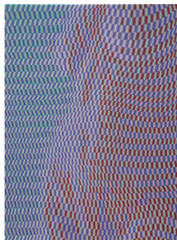
Andreas Lau Halbakt (3) , 2015 80 x 60 cm, Tempera auf Leinwand

Reinhard Voss Back to Japan , 2015 200 x 52 x 21 cm, Kieferholz, Tusche, Acryl