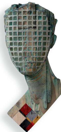
Reinhard Voss Ocean drive , 2014 40 x 16 x 7 cm Kieferholz, Tusche, Acryl